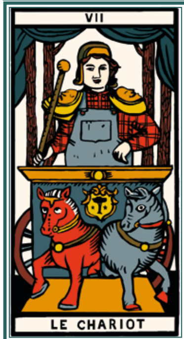
Illustration Amélie Jackowski.