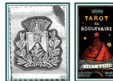
Travail sur le blason. Roquevaire.

Le Tarot du Lieu devient un vrai jeu unique de 5 cartes et une 6 ème dite « de couverture », sorte d'affiche et de blason à la fois !